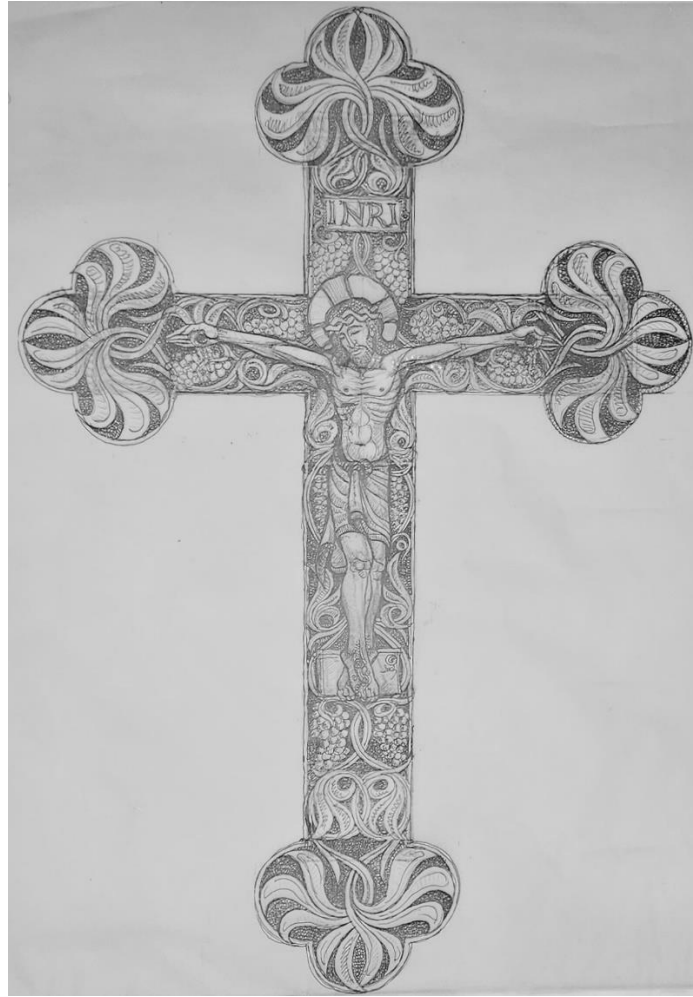
Ozsvári Csaba körmeneti kereszt terve, Budakeszi plébánia tulajdona, az Ozsvári Csaba terem keresztje