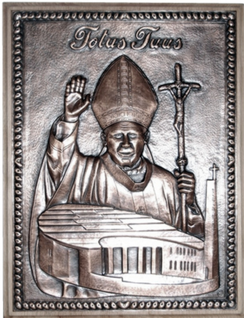
Boldog II. János Pál pápa és az új templomunk

„Amit évek alatt felépítesz, lerombolhatják egy nap alatt, MÉGIS ÉPÍTSI! ” (Calcuttai Boldog Teréz)